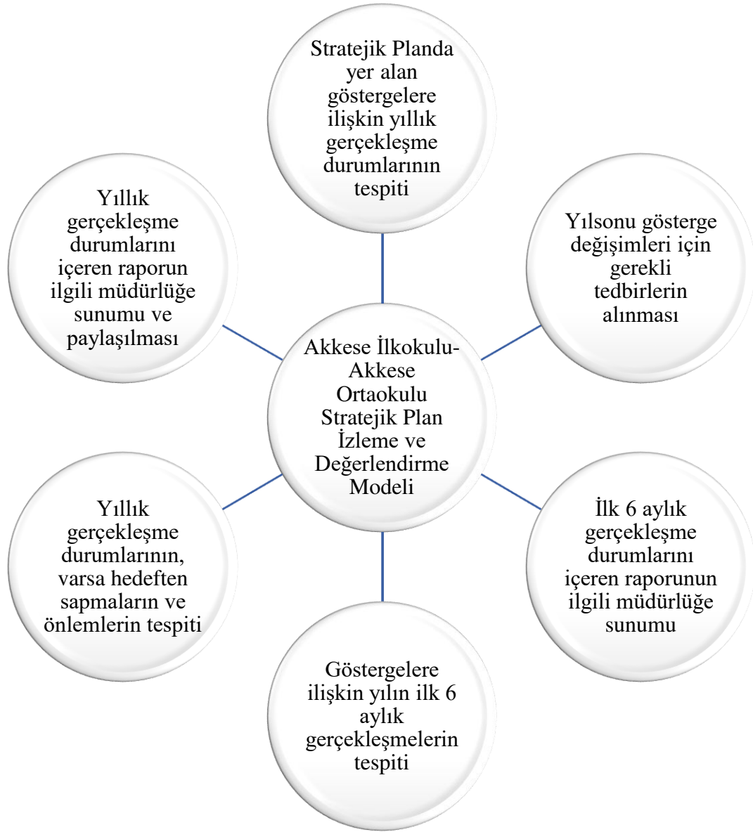
Şekil 4: İzleme Değerlendirme Modeli

Hedefe İlişkin Değerlendirme: Her yılın ilk altı ayında ilgili hedefe ait performans göstergelerinin performans düzeyi dikkate alınarak izlemenin yapıldığı yılın sonu itibarıyla hedeflenen değere ulaşıp ulaşılmadığının analizi yapılır. Hedeflenen değere ulaşılmasını engelleyecek hususlar ve riskler varsa bunlar değerlendirilir. Hedeflenen değerlere ulaşılmasını sağlayacak temel tedbirler kısaca yer verilir.