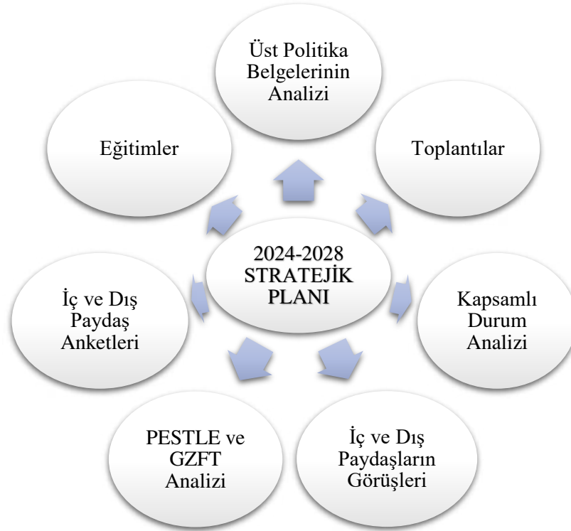
Şekil 1 : Stratejik Plan Hazırlık Aşamaları

Stratejik plan hazırlık çalışmalarının Bakanlığımız 2022/21 sayılı Genelgesi kapsamında duyurulmuştur. Genelge kapsamında Akkese İlkokul- Akkese Ortaokul Üst Kurulu ve Stratejik Planlama Ekipleri oluşturulmuş ve planın sahiplenilmesi sağlanmıştır. Hazırlık döneminde planın tüm birimlerce sahiplenilmesi, planlama sürecinin organizasyonu, ihtiyaçların tespiti, zaman planlaması gibi unsurlar ve durum analizinin yöntemleri ile geleceğe bakış kısmını oluşturan misyon, vizyon ve temel değerler kavramları gibi ana hatlar yer almaktadır.